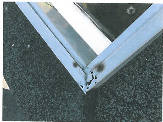
Abbildung 3: Kabelabdeckung Dachkante

Von der Ecke im Innenhof, die direkt über dem Eckfenster der Kulturlobby ist, wird das Kabel an der Fassade schwingungsfrei verlegt und im Erdgeschoss fixiert. Im Erdgeschoss wird das Kabel in einem Hohlraum hinter der Fassade bis zum Gebäude Eintrittspunkt durch Klemmvorrichtungen befestigt. Um mit dem Kabel wieder ins Gebäude zu kommen, wird ein Netzwerk-Flachbandkabel genutzt, welches in die Fensterfalz gelegt wird, ohne die Dichtungseigenschaften des Fensters zu beeinträchtigen.