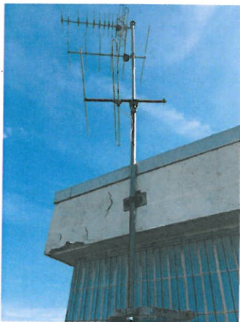
Abbildung 2: Antennenmast

Für die Verlegung des Netzkabels zur Kulturlobby im Erdgeschoss kann am Dachaufbau das vorhandene Kabelrohr (Abb. 2) und an der Dachkante die vorhandene Kabelabdeckung (Abb. 3) genutzt werden.